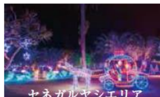
セネガルヤシエリア