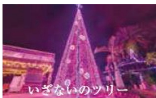
いざないのツリー