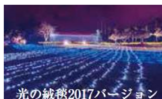
光の絨毯2017バージョン